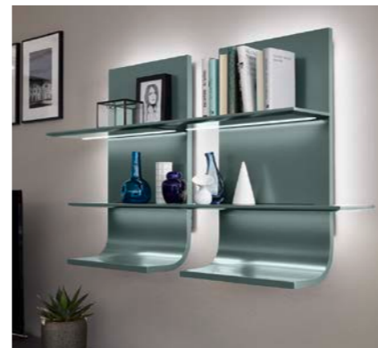
Hängemodul B 750 B/H/T ca. 75x80x28 cm