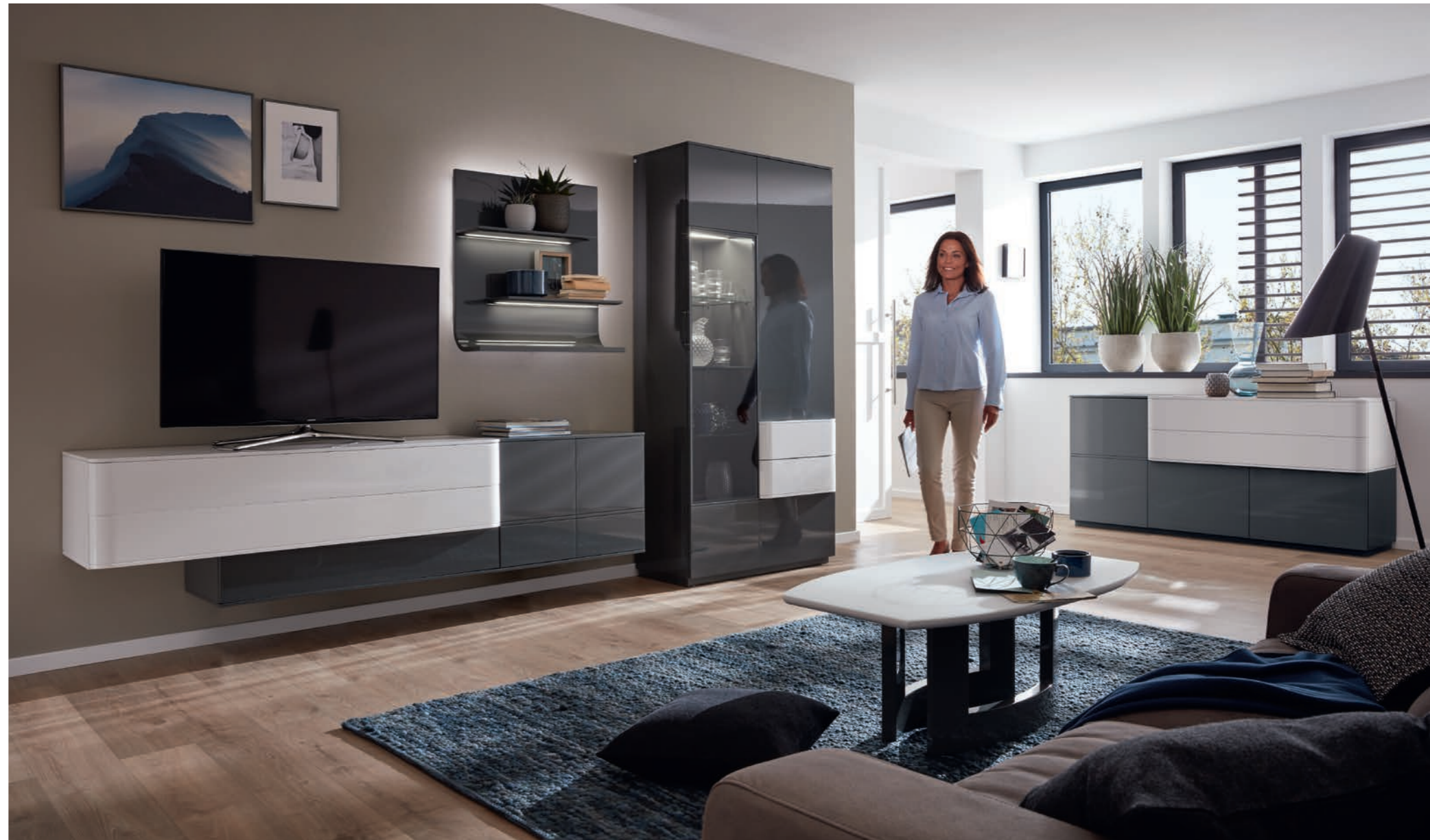
Medien-Wohnwand B/H/T ca. 294/200/53 cm.