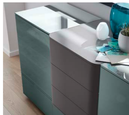
Sideboard B/H/T ca. 180/66/52 cm