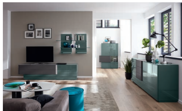
TV-Unterteil B/H/T ca. 225/54/43 cm, Bar B/H/T ca. 100/150/43 cm, Couchtisch B/H/T ca. 110/65/42 cm, Sideboard B/H/T ca. 180/66/52 cm

Esstisch B/H/T ca. 200/120/76 cm. Bar B1 links B/H/T ca. 100/150/43 cm. Bar B1 rechts B/H/T ca. 100/150/43 cm. Sideboard rechts 2000 B1 B/H/T ca. 200/86/52 cm