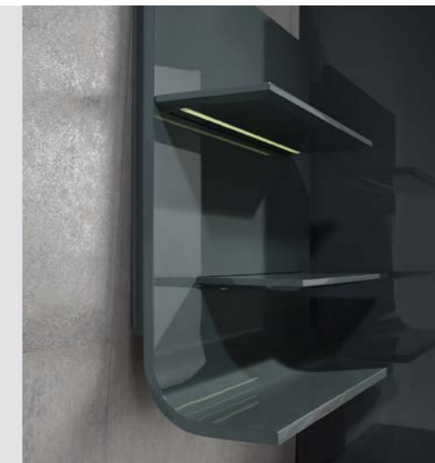
Hängemodul B/H/T ca. 750/800/24 cm.