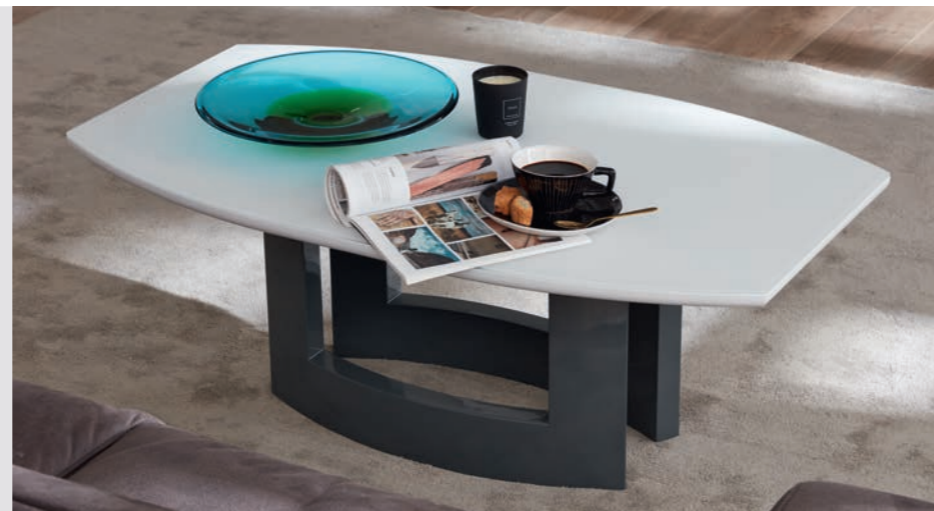
Couchtisch B/H/T ca. 110/420/65 cm.

Kabelmanagement, LED Beleuchtung – MONDO BENVIDO sorgt für clevere Funktionen und geordnete Unterbringung.