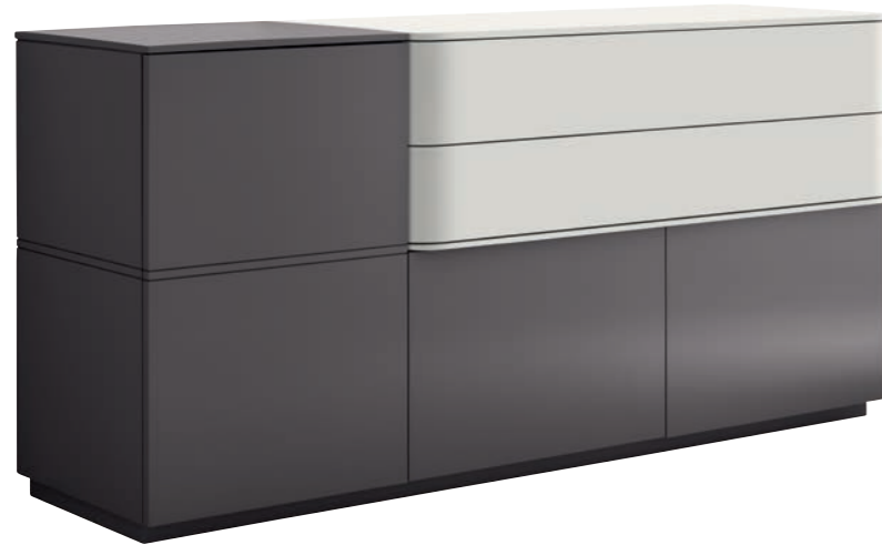
Sideboard B/H/T ca. 180/860/522 cm.